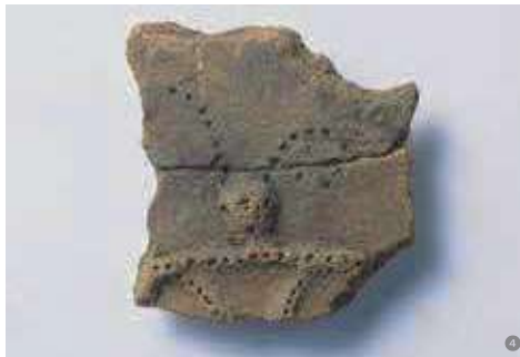
①粘土探掘坑 ②土屋根建物(復元) ③アスファルト塊とパレット土器 ④羽付き縄文人